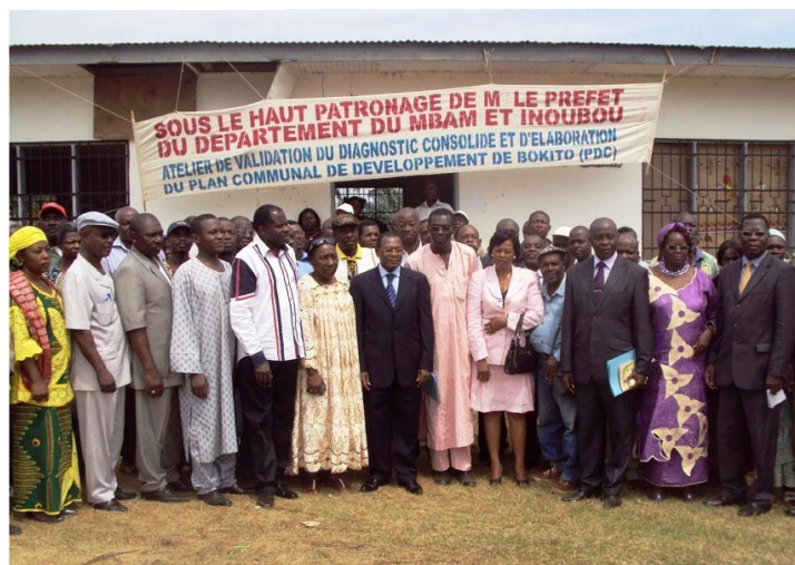
Photo 13 : Photo d'ensemble à la clôture de l'atelier de validation du PCD