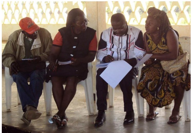
Photo 12 : Une attitude des participants en commission « du sérieux »