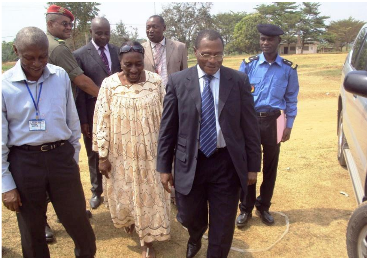
Photo1 : Arrivée de Mr le Préfet du Département du Mbam et Inoubou à l'atelier de validation du PCD