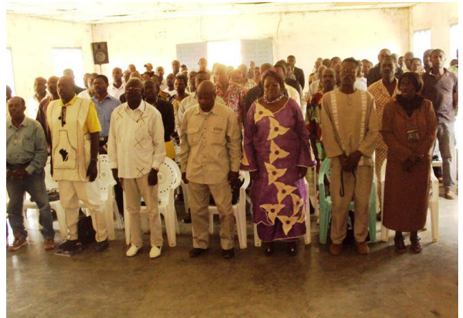
Photo 10 : Attitude des participants lors de l'exécution de l'hymne national