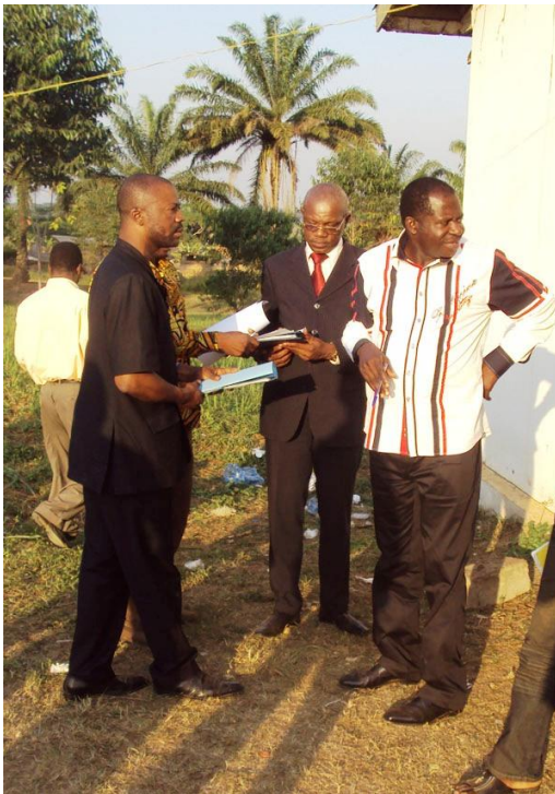
Photo 11 : Echange entre sectoriels et participant lors d'une pause