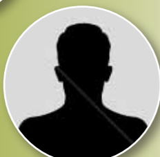
NYEMEK Moïse Charles