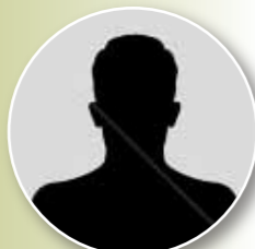
BITODEN A BESSEKE