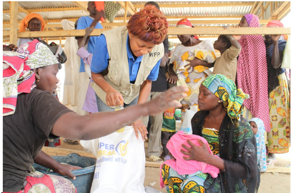
Distribution d'intrants nutritionnels du PAM dans le cadre du Programme d'Alimentation de couverture.