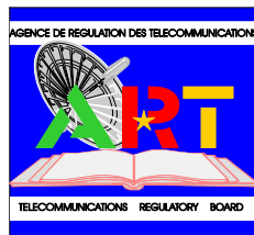
Tableau de bord trimestriel du marché de la téléphonie mobile